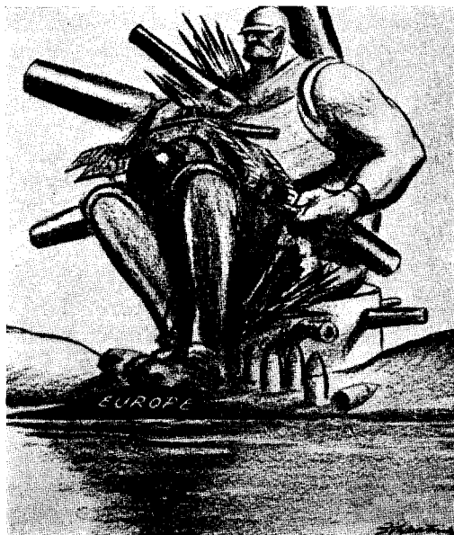
Geologerna påstå att Europa håller på att sjunka under havsytan.

City översvämmas av kapital som förtäres av begär att bli placerat som räntabla lån ute i världen, vare det än så att låntagaren uppenbart är ett hot mot Englands söner och framför allt Englands flotta.