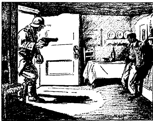
Du är ett hot mot Europas fred!

Sedan Hitler 1933 kom till makten inriktades Tysklands strävanden på att likvidera versaillesfreden och frigöra landet från segerstaternas förmynderskap och inringning. Den första åtgärden var att med ignorandet av fredsbetingelserna på nytt göra Tyskland till en militärmakt på basis av vilken landet åter kunde icke bara hävda sig utan bygga upp ett nytt världsvälde, först genom absorberandet av alla tyska element utanför Tyskland. När den