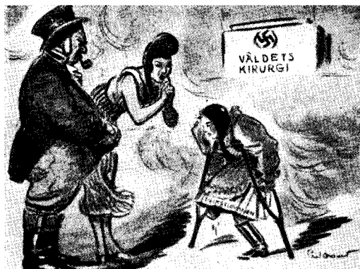
Vårt barn är amputerat, men det lever!

Englands politik var ett uttryck för den nationalkapitalistiska intressepolitik, som framkallar krig. England ville för egen del exploatera Sydösteuropas stater och stänga dörren för Tysklands handel. Men Tyskland reagerade snabbt. Tjeckoslovakien var nyckeln till Tysklands framträngande i Sydösteuropa. Den var en mäktig fransk befästning, farlig för Tyskland och dess kapitalistiska expansion. Det blev icke Tysklands armé som strök flagg för den engelska finanssen; det